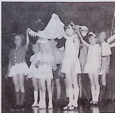
„Pünkösdő” a stuttgarti magyar evangélikus gyülekezetnél.