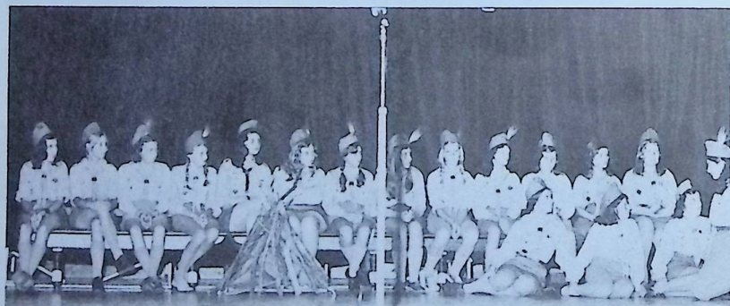
Fent: Egy melbournei ünnepély 3 jelene.

Nagyban folyt a leánytábor latrinájának az ásása (a lányok maguk csinálták) és az egyik vezető elküldte a Liliom-örs egyik tagját, hogy hozzon egy csákányt. Ő szép illedelmesen oda is állított a szertáros-hoz és a sietéstől lihegve, mint a ki-nek nagyon sürgős a dolog mondta: Kérek egy csájkát a latrinaásáshoz.