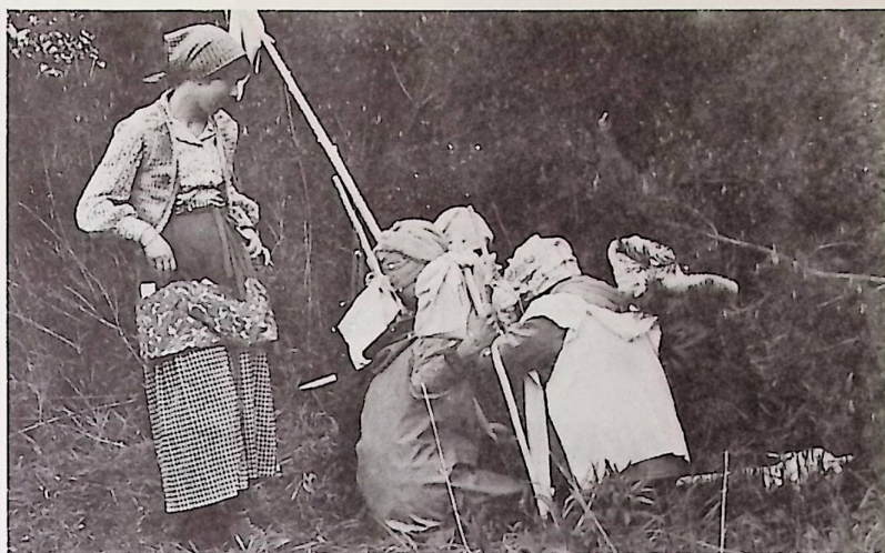
A „törökök” ügyködnek.