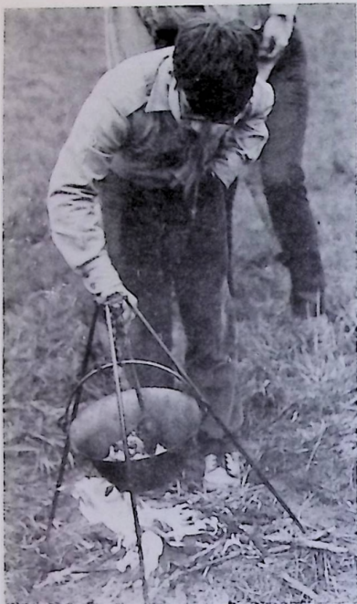
A főzés tudománynak számít, főleg, ha pontozzák.