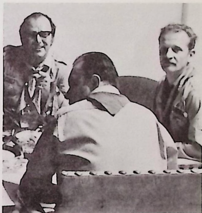
Diskuráló csoportok a new yorki közgyűlés szünetében.