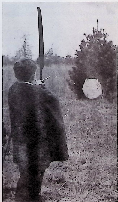
Nyilazás,—az a baj, hogy ezt is pontozzák.